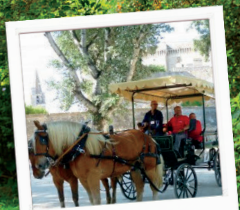
Promenade en cariote