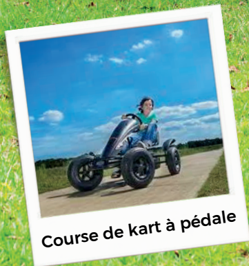
Course de kart à pédale